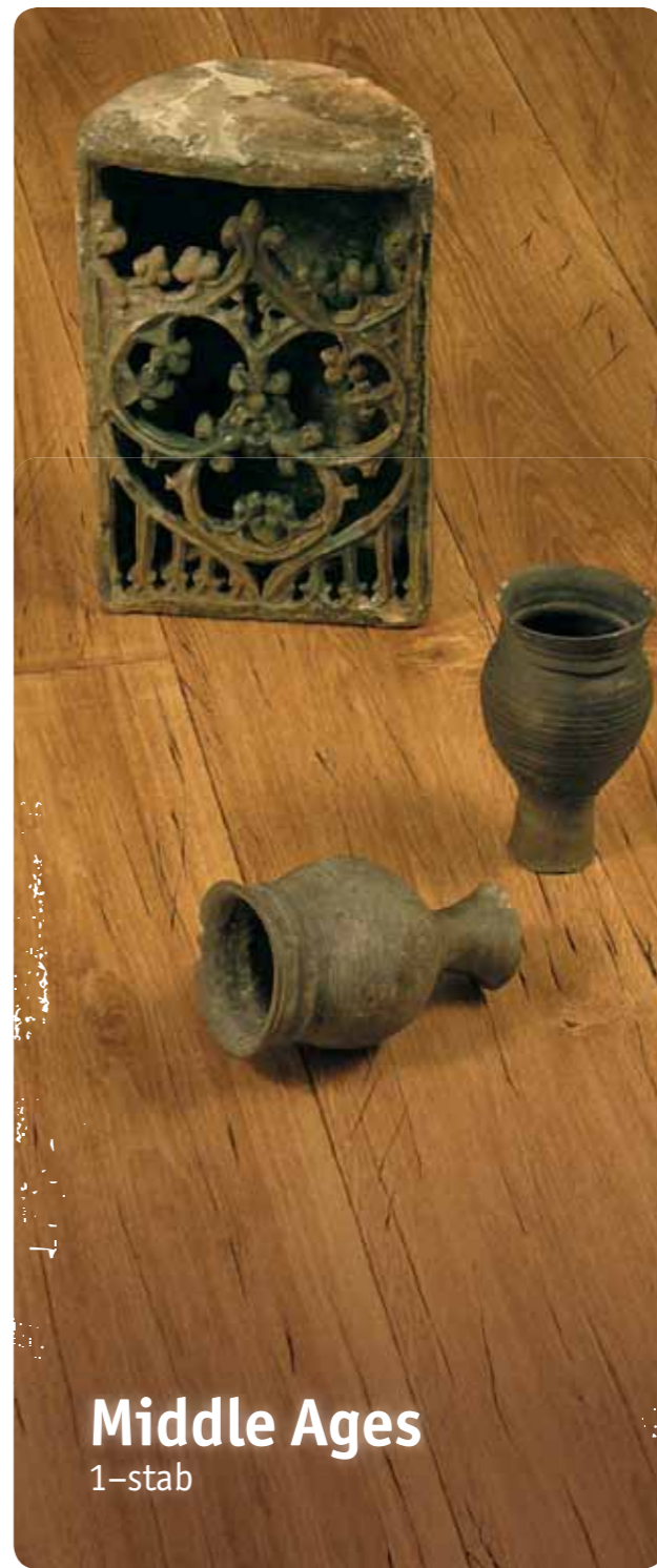
Middle Ages 1-stab