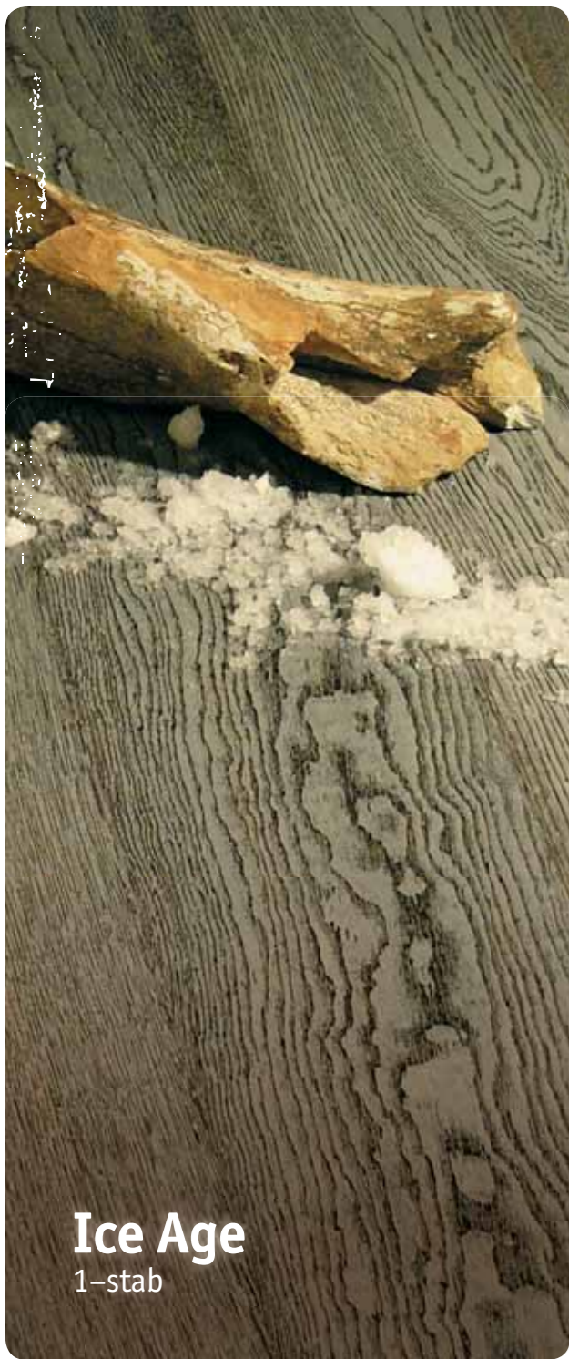
Ice Age 1-stab