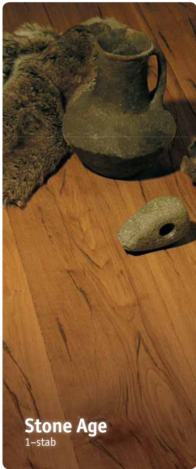
Stone Age 1-stab