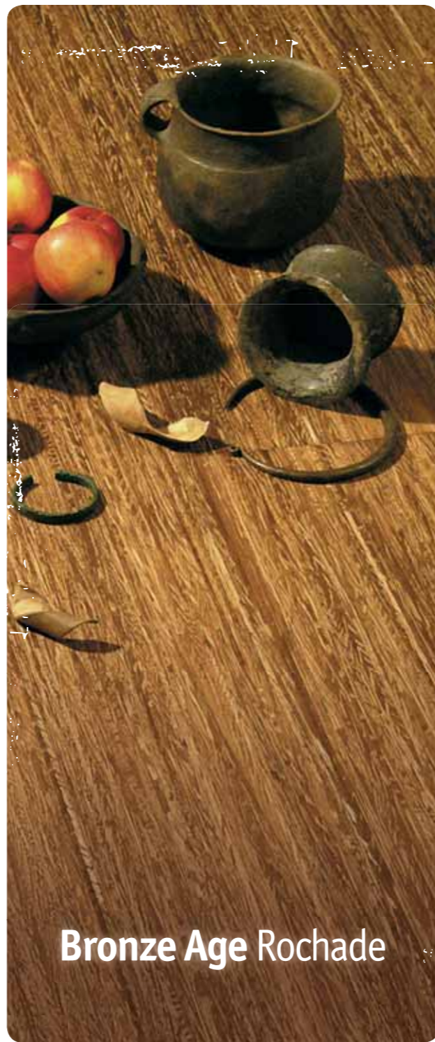
Bronze Age Rochade