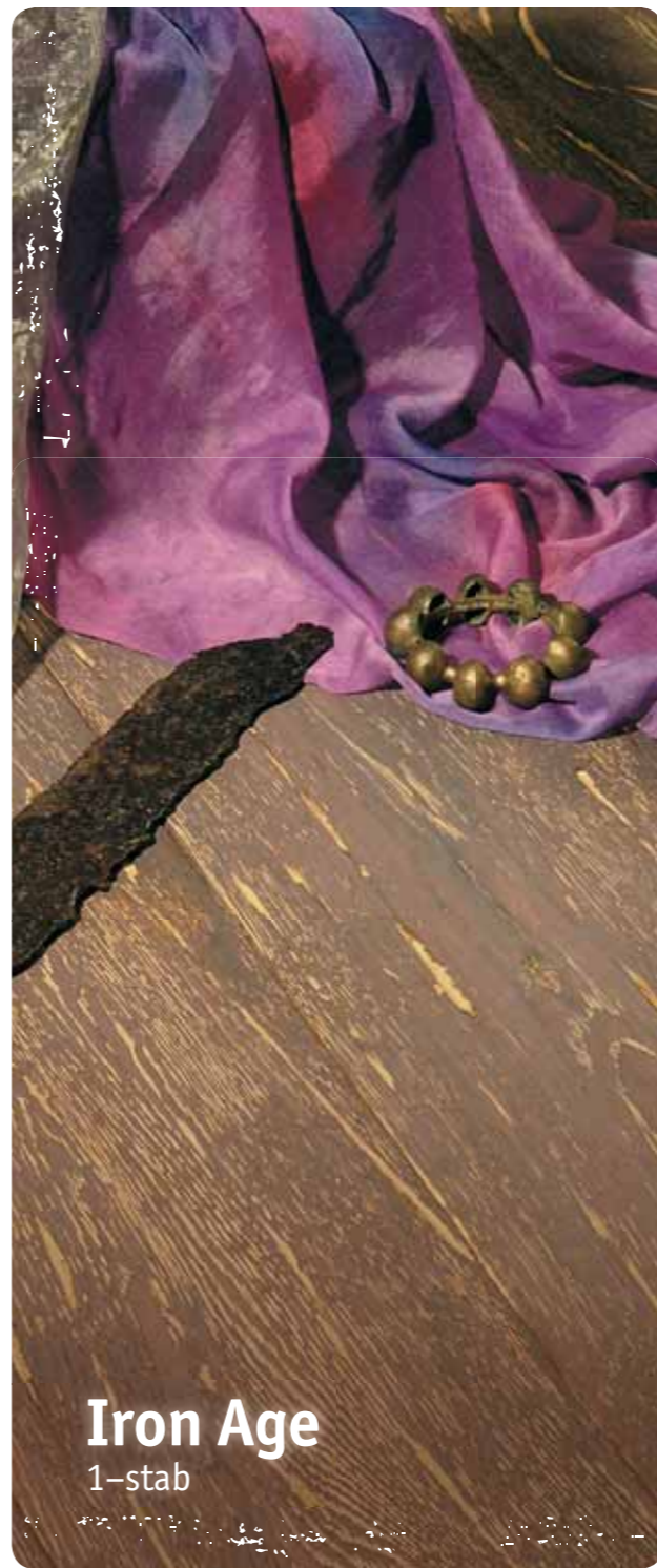
Iron Age 1-stab